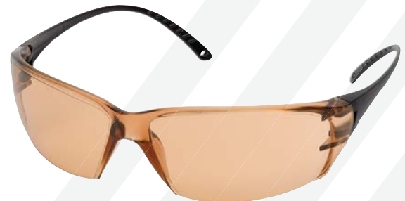
Helium 18™ SG-59BB50-AF