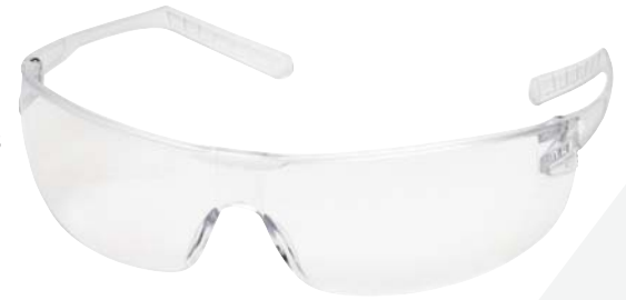
Helium 15™ SG-58C

Las patillas ErgoFit™ tanto de Helium 15™ como de Helium 18™ están diseñadas para ser delgadas y ajustarse al contorno de su cabeza para un ajuste increíblemente seguro y cómodo incluso con protección auditiva y otros EPP.