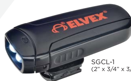
SGCL-1 (2" x 3/4" x 3/8")

¡La LED luz con presilla de Elvex® está facilitando su trabajo! Ajuste a sus gafas de seguridad, su careta o visor facial, su casco de seguridad, etc. Es liviano, ofrece una base giratoria de 360° de modo que pueda apuntar a donde se necesite luz y está alojada en una carcasa resistente al agua. La LED luz con presilla de Elvex® ofrece una luz muy brillante para quienes se les dificulta ver en áreas con poca luz.